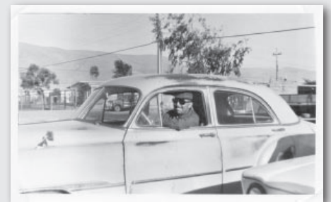
Mi padre (1974) luciendo su Chevrolet 51 celeste en Iquique. Un gran y hermoso auto que fue vendido en Curicó en 1976. Tal vez aún circule por las calles de la Región del Maule. Sería un sueño. Podemos apreciar la pintura desgastada de tanto sacarle brillo, situación común en autos que duraban más de 20 años con su pintura original. --- Heriberto Mancilla .