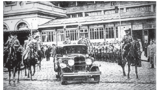
En esta fotografía encontrada por casualidad en una antigua revista de 'Novedades', se aprecia la llegada del Presidente de la República Sr. Arturo Alessandri a Temuco en 1935, saliendo de la Estación de Ferrocarriles, (edificio datado en 1895), convenientemente escoltado por un escuadrón de caballería. No menos importante es que en la foto se refleja que en su época dorada, Studebaker también fabricaba automóviles de lujo. En efecto, el Sr. Presidente, consecuentemente, utiliza un espléndido Studebaker modelo President State Sedan, equipado con un poderoso ocho cilindros en línea, de 115 caballos de fuerza y un estanque de gasolina para 16 galones.