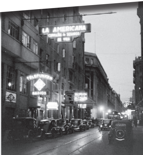
El Centro de Santiago, por su forma y ambiente, era el Nueva York chileno. Esta escena de un invernol atardecer en 1941 destaca por la gran cantidad de avisos luminosos que en esa época existía. En lo que a nosotros nos interesa, podemos identificar, estacionado a la derecha un Ford de 1935, con su repuesto en la tapa de la maleta. A la izquierda un Ford de 1929-30, un redondo Ford 1938-41, un tercer auto no identificado y luego un Chevrolet cupé de 1941. Al centro, a lo lejos, se alcanza a divisar un tranvía. --- La Gaceta de los Clásicos .