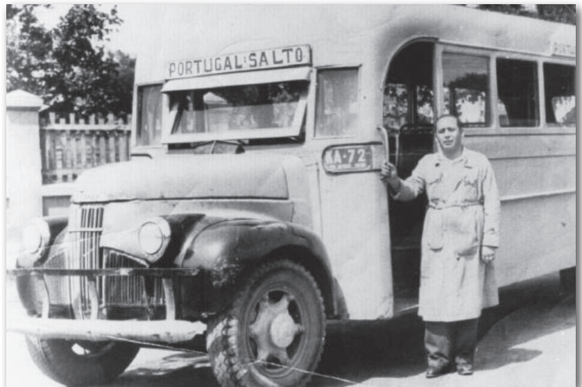
En los años 40, la mayor parte de los autobuses de Santiago eran construidos con carrocerías chilenas sobre chasis estadounidenses. La industria carrocería permitió el desarrollo de capacidades industriales y artesanales hoy perdidas. En la foto, tomada alrededor de 1955, se muestra un ya antiguo autobús construido sobre un chasis Studebaker M5 de 1947, cuyo motor de seis cilindros tendría un duro trabajo en las adoquinadas calles de Santiago. Nótese los detalles de terminación de la carrocería que estaba construida con planchas de latón por fuera, sobre una estructura de madera y forrada internamente con madera tipo enchapada, barnizada de color crema. Los asientos eran de crin animal o vegetal, tapizados de hule. El recorrido Portugal - El Salto , partía desde la estación San Diego del ferrocarril de circunvalación, que en la época de la fotografía ya no llevaba pasajeros, hasta El Salto. Nótese también el uniforme del chofer quien lleva una larga y elegante cotona, tal vez del antiguamente denominado color cáscara . --- La Gaceta de los Clásicos .