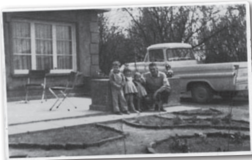
Foto tomada en 1961 en Santa Cruz. La camioneta GMC de la familia, un escaso modelo de lujo Fleetside de 1959 con parabrisas trasero panorámico. Aparecen mi papá y mis hermanas. Yo soy el más grande, tenía 4 años. --- Sergio Soto L.