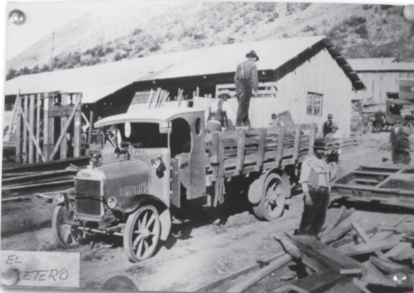
Dennis es un fabricante británico de camiones y buses. Creada en 1895 como fábrica de bicicletas, ya en 1899 estaba fabricando camiones, lo que sigue haciendo hasta el día de hoy. La foto fue encontrada expuesta en Valparaíso, por lo cual suponemos que fue tomada en esa zona. Sin embargo, los registros Dennis de la época sólo acusan una entrega a Chile, para Antofagasta Railways, empresa en esa época en manos inglesas, el 29 de septiembre de 1924. Sin embargo hay varias entregas no conocidas. Los Dennis eran vehículos de alta potencia, creados para trabajo duro. En la foto observe con atención el gran claxon al centro del parabrisas, así como también las ruedas de goma maciza y el primitivo y desprotegido habitáculo para el chofer. --- La Gaceta de los Clásicos .